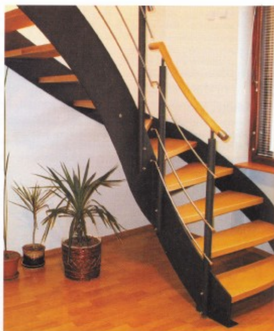
Dřevěné nášlapy a ocelové schodnice v „přetočeném“ provedení