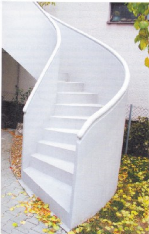
Individuálně, na místě odité betonové schodiště

Podobná situace je i u schodišť dřevěných. Dodavatelé nabízejí obvyklá místní dřeva – smrk, borovice, modřín, buk, dub, jasan, javor, olše, břıza, třeseň, ořech, pařený buk, lepený buk cínk, dub cínk, ale i dřeva exotická, která mají velmi reprezentativní charakter. Současné nabízejí i vysoce kvalitní povrchovou úpravu, skvěle odolávající vlhkosti.