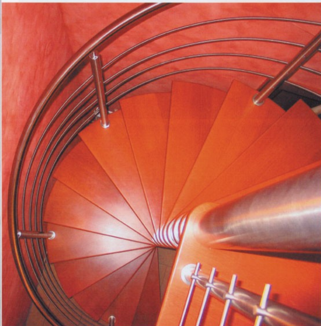
Vřetenové schodiště, kombinace dřeva a kovu

PŘIPRAVIL: ŠTĚPÁN ORAVSKÝ