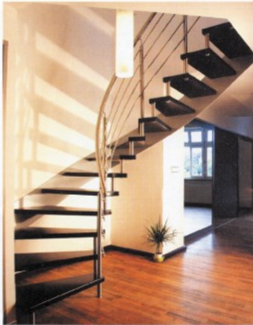
Bočnicové řešení částečně samonosných nášlapů – kov natřené dřevo

Při výběru schodiště může každý stavař použít reference výrobce, který má obvykle mnoho fotografií již vyrobených schodišť. Mnozí výrobci mají v nabídce normované půdorysy schodišť, někteří nabízejí i jednoduché programy, podle kterých si můžeme navrhnout základní tvar schodiště sami. Po zaměření a předběžném rozhodnutí o typu, který chceme použít, výrobce navrhne konkrétní schodiště včetně zábradlí, balustrád, přípevnovacích otvorů apod. Tento návrh se provádí na počítačích. Prakticky každé schodiště je unikátní, navrženo pro konkrétní prostor a konkrétní zatížení. Výroba každého schodiště je kusovou výrobou. V jednodušším případě jsou tvary jednotlivých prvků vytýštěny na velkoplošných plotrech v měřítku 1:1, a podle tohoto podkladu pak následně vyrobeny. Někteří výrobci však přenesou údaje přímo do číslicově řízených strojů. Zvláště u zakřivených schodišť může mít každý nášlap jiný tvar a schodnice tvar velmi složitý. ■