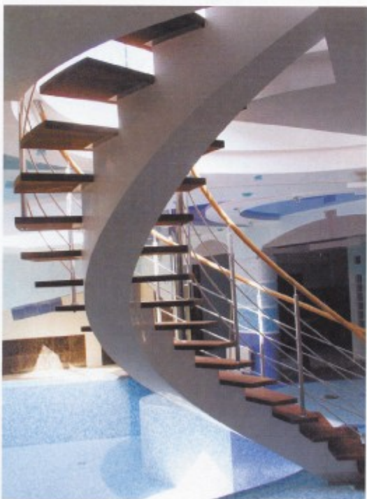
Nosná část z monolitického betonu, zábradlí je vedeno nášlapy

Při výrobě těchto nášlapů se využívají všechny technologie zdobení skla. Sklo může být barevné, matné, pískované, může mít popisy apod.