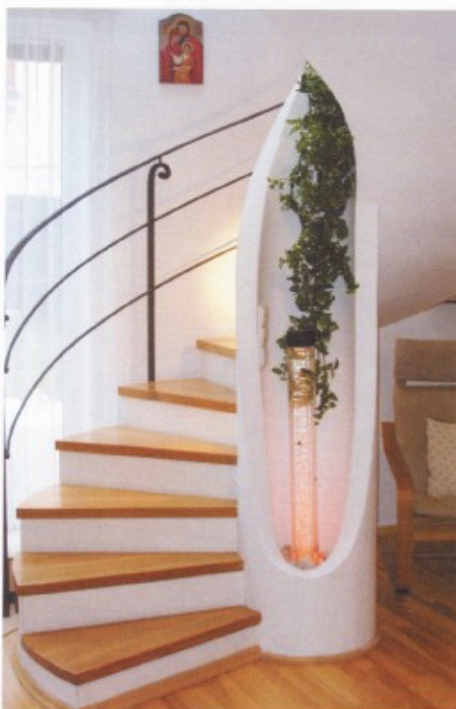
Výetenové schodiště z betonu, odlehčené dřevěnými náslapy

Pro výrobu náslapů a zábradlí je možné využít i sklo. Náslapy jsou vyráběny z mnohvrstevných lepených skel, skla se běžně vytvrzují a mají úpravu, která zabraňuje tvorbě větších škvárovitých kusů po rozbití.