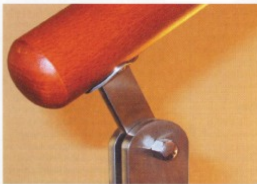
▼ Dřevěná madla s ocelovou, technicky pojatou konstrukcí zábradlí