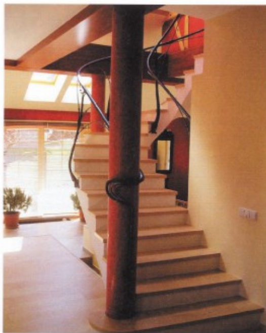
Na místě vytvořený složitý tvar monolitického betonového schodiště